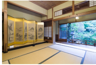
旧齋藤家別邸会場