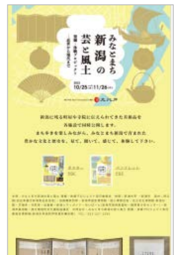
特設ウェブサイト

プロジェクトの成果をまとめた記録集を作成した。PDFデータは特設ウェブサイトに掲載した。