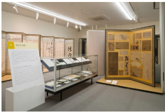
新潟大学旭町学術資料展示館会場

プロジェクト中核館である新潟大学旭町学術資料展示館、プロジェクト連携館及び近隣の文化施設、料亭、飲食店、寺院など9会場で、新潟市内に残る美術・工芸品などの作品を展示した。あわせて新潟大学旭町学術資料展示館では、新潟大学の東洋美術史の研究成果も展示した。各会場を巡ることで地域の歴史・文化・芸術を体感していただいた。