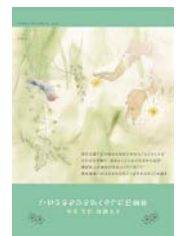
ブックリスト「日本の絵本のあゆみ」「ちひろがくらしした石神井」