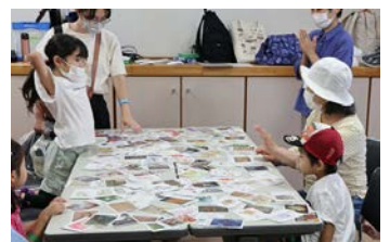
所蔵品カードワークショップ