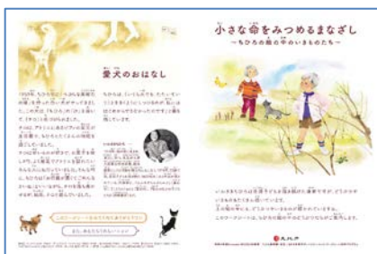
ワークシート「小さな命をみつめるまなざし」