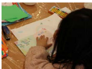
子どもワークショップ

参加者の声 「話しながら、考えながら絵を深く感じるという、不思議な経験。」「一枚の絵にふたつ以上のストーリーがあることに初めて気づいた。」「いつもと違う自分を発見した。そのことに感動した。」